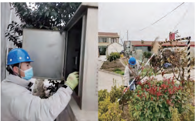
春节期间,为保障辖区电网安全稳定运行,供电工程分公司保电人员24小时在岗值守,确保设备健康运行、客户舒心用电、应急措施有力,用真情服务“电”亮万家年味浓。(王芬)

当好职工安心的“娘家人”。贯彻落实集团职代会精神,落实福利待遇,解决职工后顾之忧。按时定期发放劳保用品,为公司员工发放冬季防寒工作服;深化“一星三制”产改机制,使能力与工资挂钩,激发职工的干劲,增添企业发展的活力;在春节前夕,开展文体周活动,增强职工凝聚力向心力;在职工生日时发放蛋糕券、生日贺卡,打造“职工之家”。充分调动了广大职工的积极性、主动性、创造性,公司的生产力也得到进一步的释放和发展。(许东彦)