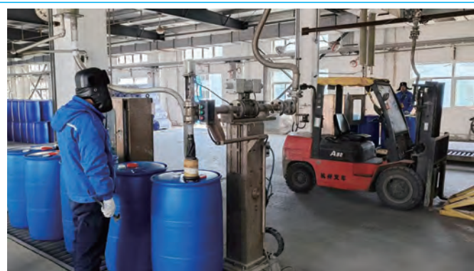
春节期间,利海化工公司134名职工分别在生产、维保、化验、包装等岗位上辛勤的工作,为保证公司节日期间产品的正常生产和供应,他们放弃了与家人团聚的机会,用坚守诠释责任担当,成为新春一道最亮丽的风景线。(曹加余 林涛)

坚持齐抓共管,全力维护和谐稳定发展局面。抓实安全生产,树牢“安全就是最好民生,安全就是最大效益”的理念,稳定安全生产秩序。抓好民生实事,做实春送温暖、夏送清凉、金秋助学、冬送健康“四季歌”暖心关爱工程。抓牢意识形态,依托“一线课堂”“道德讲堂”“廉政图书角”等平台载体,引导员工正确认识大局,坚决维护稳定、自觉服务发展。抓实安康驿站创建,营造和谐稳定的发展环境。(房金鹤)